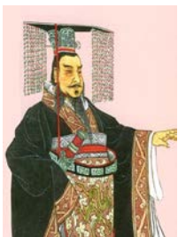
A. 嬴政 (Yíng Zhèng)

[ Zhōngguó lìshǐ shàng bèi chēngwéi “shǐ huángdì” de shì _____。 ]