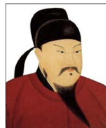
C. 李世民 (Lǐ Shìmín)