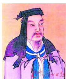
B. 曹操 (Cáo Cāo)